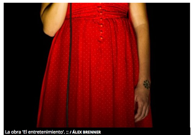
La obra 'El entretenimiento'.